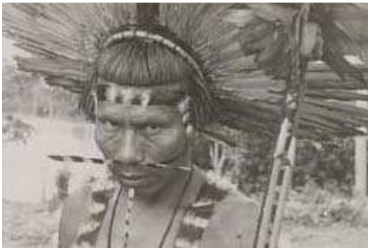
Indigène de la moitié Cera et du clan Cibo en costume de cérémonie.