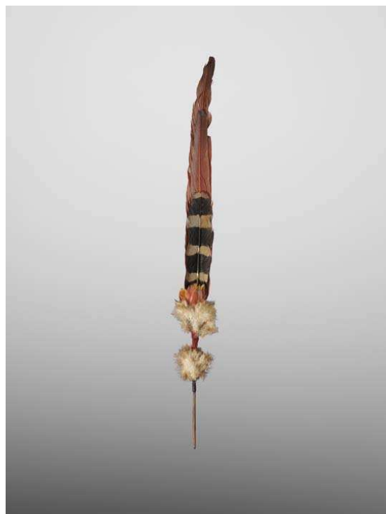
Epingle de cheveux