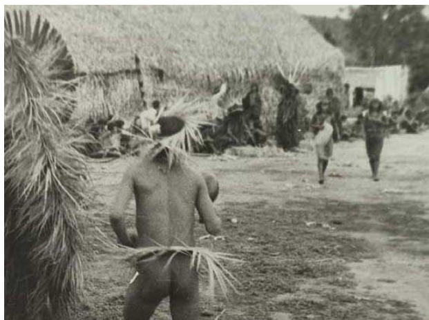
Danseurs du clan Paiwe