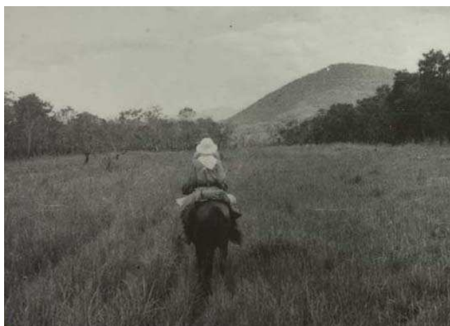
Le Pantanal, au pied de la serra Bodoquena, aux environs du village de Nalike, capitale du pays Caduveo