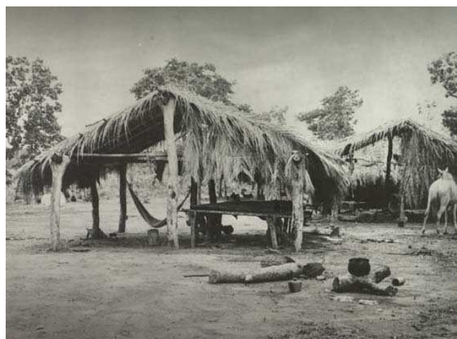
Aspect du village de Nalike, dans la Serra Bodoquena [Habitations]