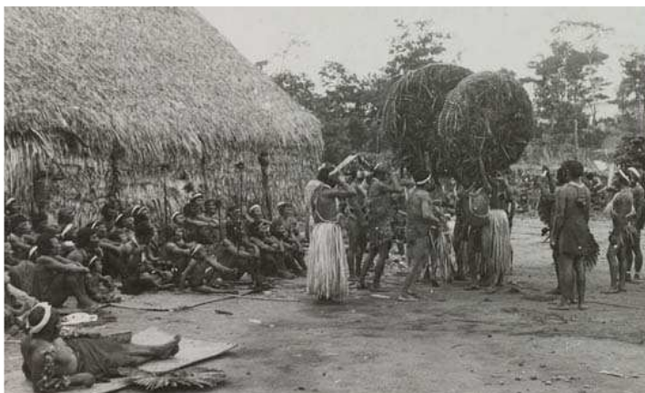
La danse du mariddo