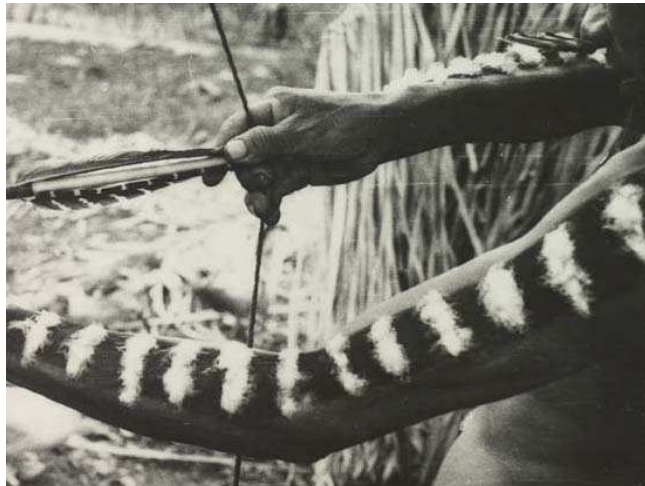
Position de la main droite pour le tir à l'arc