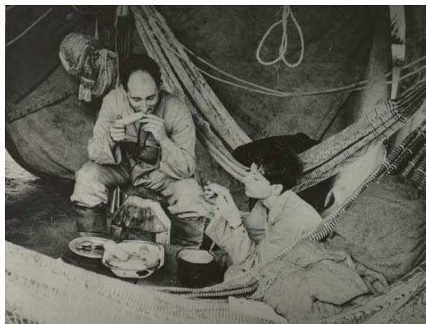
La mission Lévi-Strauss dans son campement