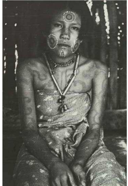
Jeune fille Caduveo en tenue de fête