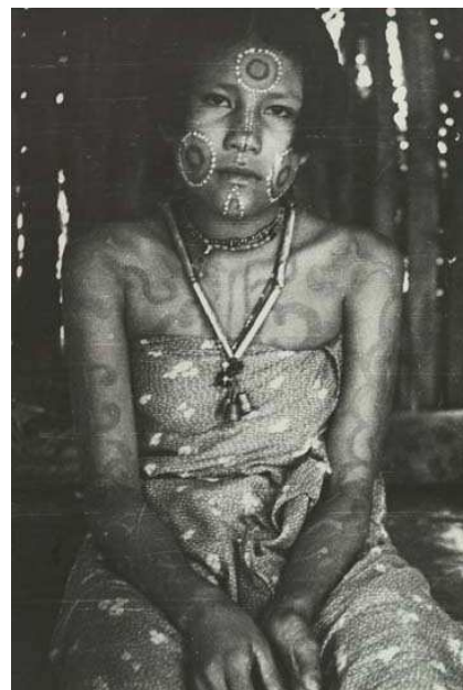
Jeune fille Caduveo en tenue de fête