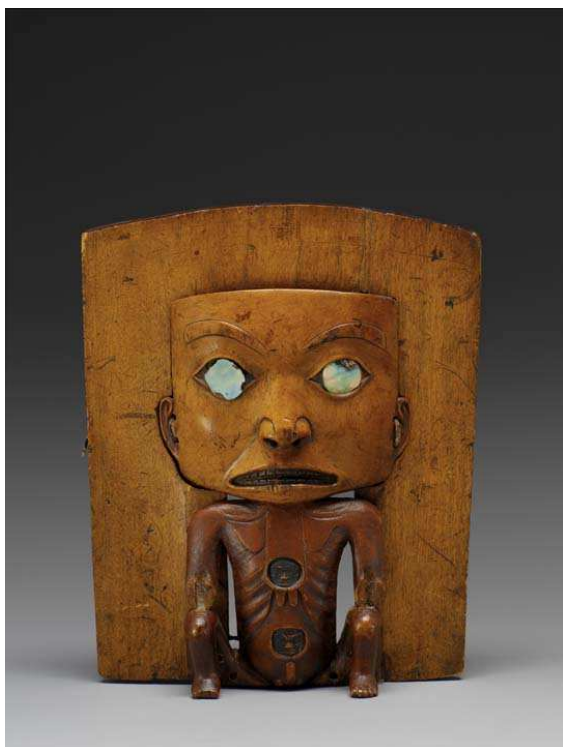
Parure frontale de coiffure de cérémonie

Cinq pièces exceptionnelles ayant appartenu à Claude Lévi-Strauss, et provenant de la Côte Nord-Ouest de l'Amérique du Nord (Colombie britannique et Alaska) sont entrées dans les collections du musée de l'Homme et du musée du quai Branly dans un tout autre contexte.