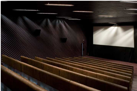
Salle de cinéma

Tout au long de cette journée anniversaire, le musée propose en continu des projections de films documentaires et d'archives audiovisuelles sur Claude Lévi-Strauss, venus en particulier des fonds de l'INA.