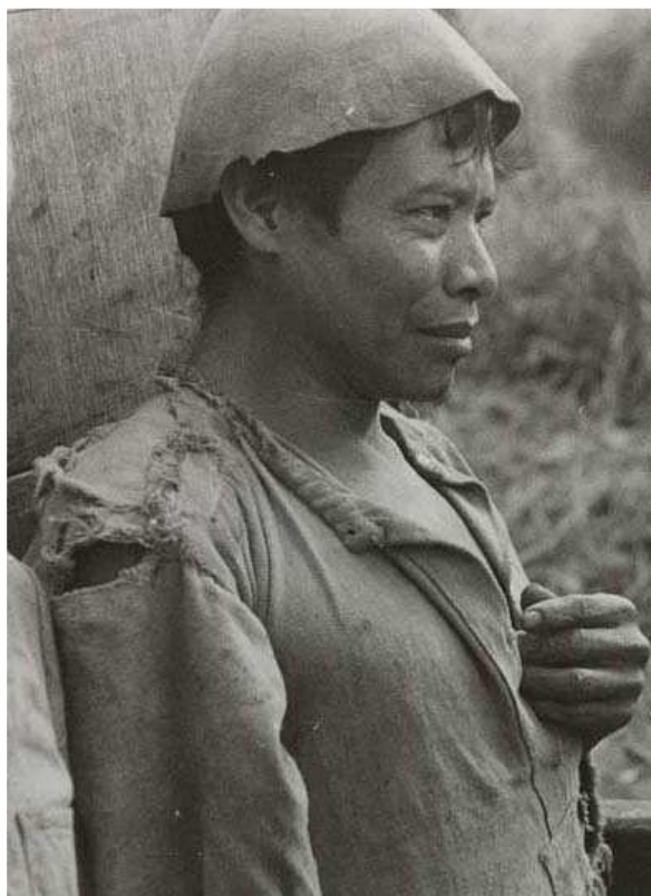
Indien Guarani