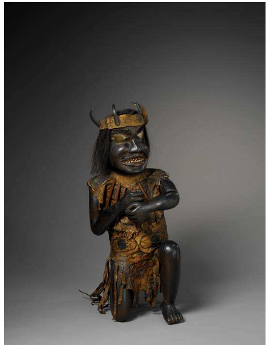
Statue de chaman