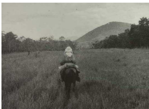
Le Pantanal, au pied de la serra Bodoquena, aux environs du village de Nalike, capitale du pays Caduveo

A dater de ce jour anniversaire et durant un mois, le musée expose, dans le salon de lecture Jacques Kerchache, les photographies de terrain réalisées par Claude Lévi-Strauss et dont il a fait don au musée.