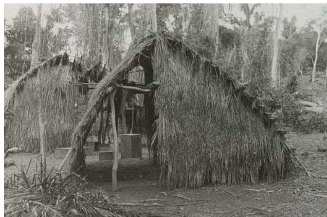
Habitations temporaires Guarani