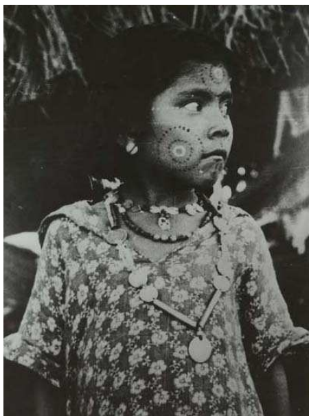
Fillette Caduveo au visage peint