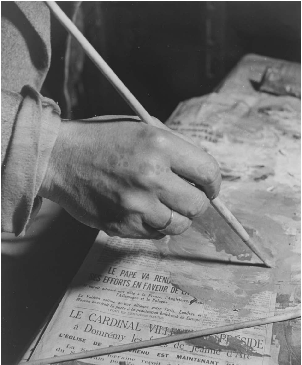
© Brassai® Estate BRASSAI/distr. RMN-Thierry Lepage

« Les travaux de création artistique ou de recherche scientifique, mais aussi des activités moins prestigieuses telles que la publicité, le jeu, le sport, la bourse, le combat, comptent parmi les entreprises humaines les plus faiblement routinières et dont l'issue est très imparfaitement prévisible ». Photo de Picasso peignant sur un journal par Brassai (1899-1984), septembre 1939.