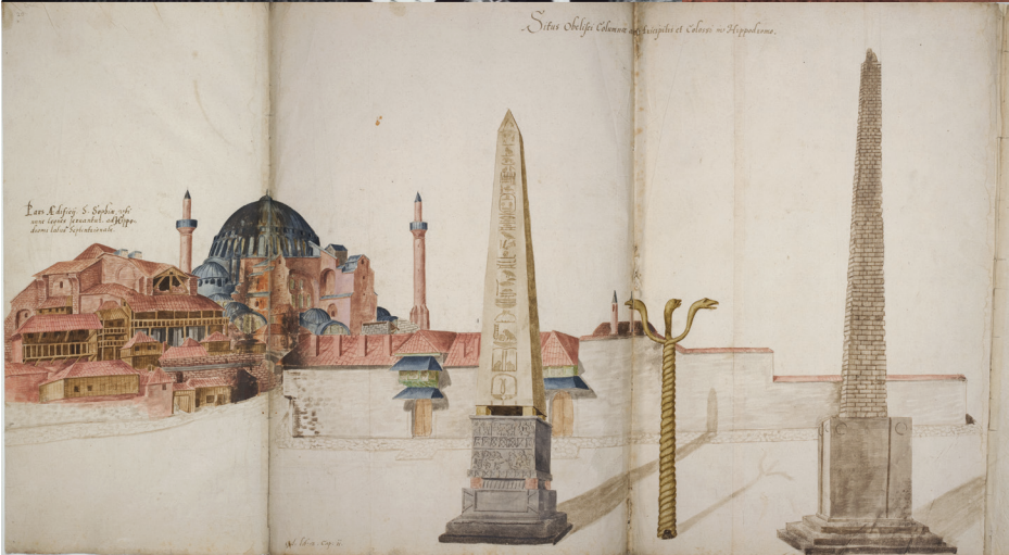
Les monuments de l'Hippodrome. Album Freshfield (1574), fol o 20.

et à l'Académie des Inscriptions et Belles-Lettres