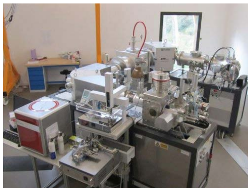
Photo. Le spectromètre AixMICADAS au CEREGE d'Aix-en-Provence. Unité du radiocarbone

Cet effort international inclut les résultats obtenus par le CEREGE qui dispose du spectromètre AixMICADAS (voir photo) installé dans le cadre des projets EQUIPEX ASTER-CEREGE et ANR CARBOTRYDH. Une comparaison internationale sur des séries d'arbres subfossiles 2 montre la qualité de ces nouvelles datations réalisées au moyen de cet instrument 3 . Le CEREGE fait partie du groupe des huit laboratoires les plus justes et les plus précis au monde, qui ont tous été mis à contribution pour l'établissement de cette nouvelle calibration.