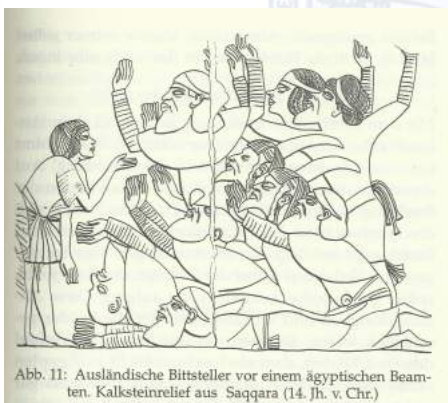
Abb. 11: Ausländische Bittsteller vor einem ägyptischen Beamten. Kalksteinrelief aus Saqqara (14. Jh. v. Chr.)