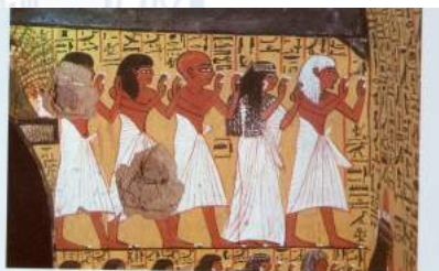
Abb. 25 Sehr selten findet man die Darstellung eines grau- bzw. weisharigen alten Menschen wie im Grabe des Paschedu, TT 3 in Deir el Medina (französisch)