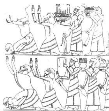
Abb. 12: Asiaten überbringen einem ägyptischen Beamten kostbare Gaben als Tribut. Wandmalerei aus einem Grab in Abd el Ourna (15. Jh. v. Chr.)