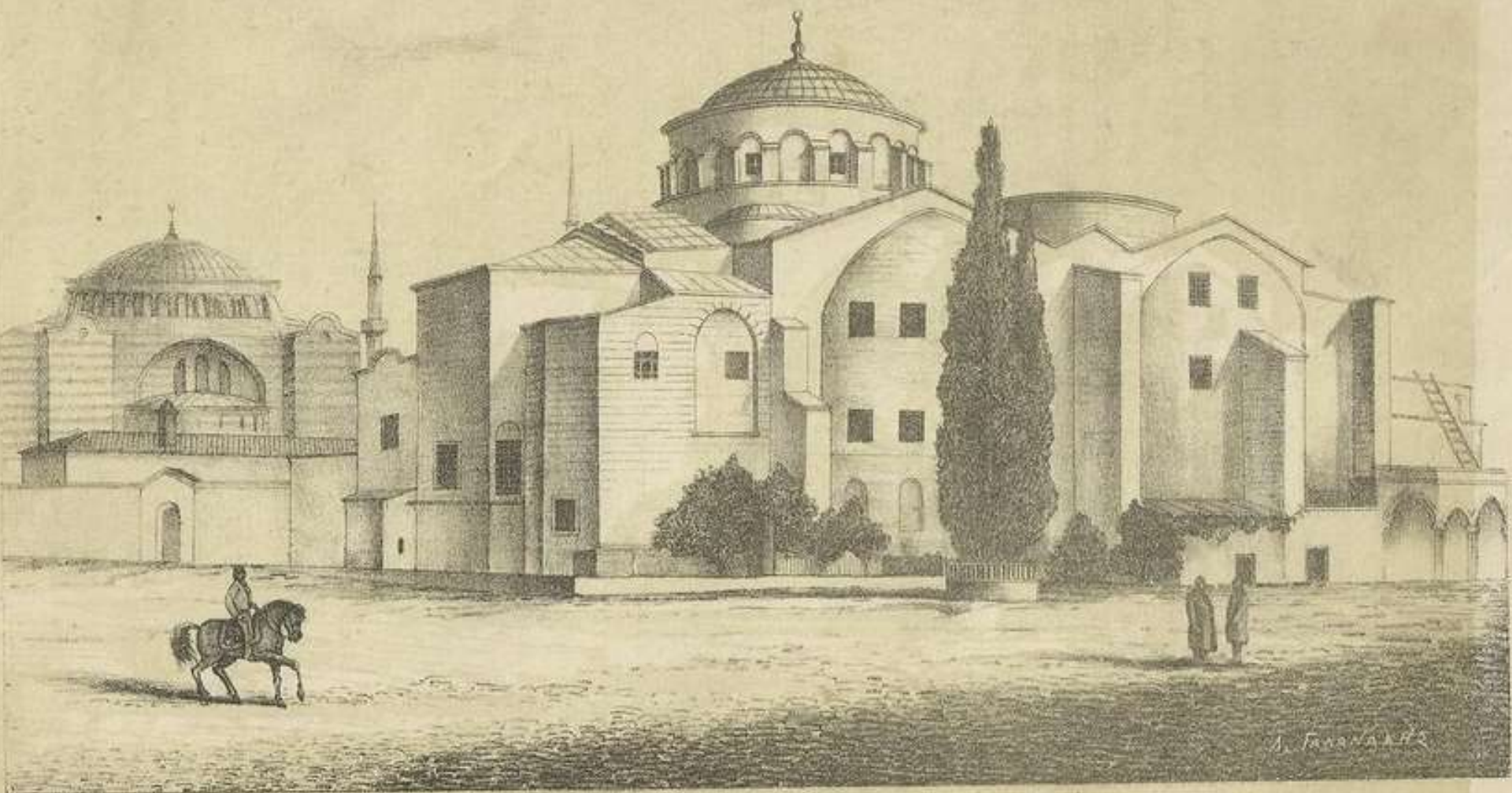
ΝΑΟΣ ΤΗΣ ΑΓΙΑΣ ΕΙΡΗΝΗΣ