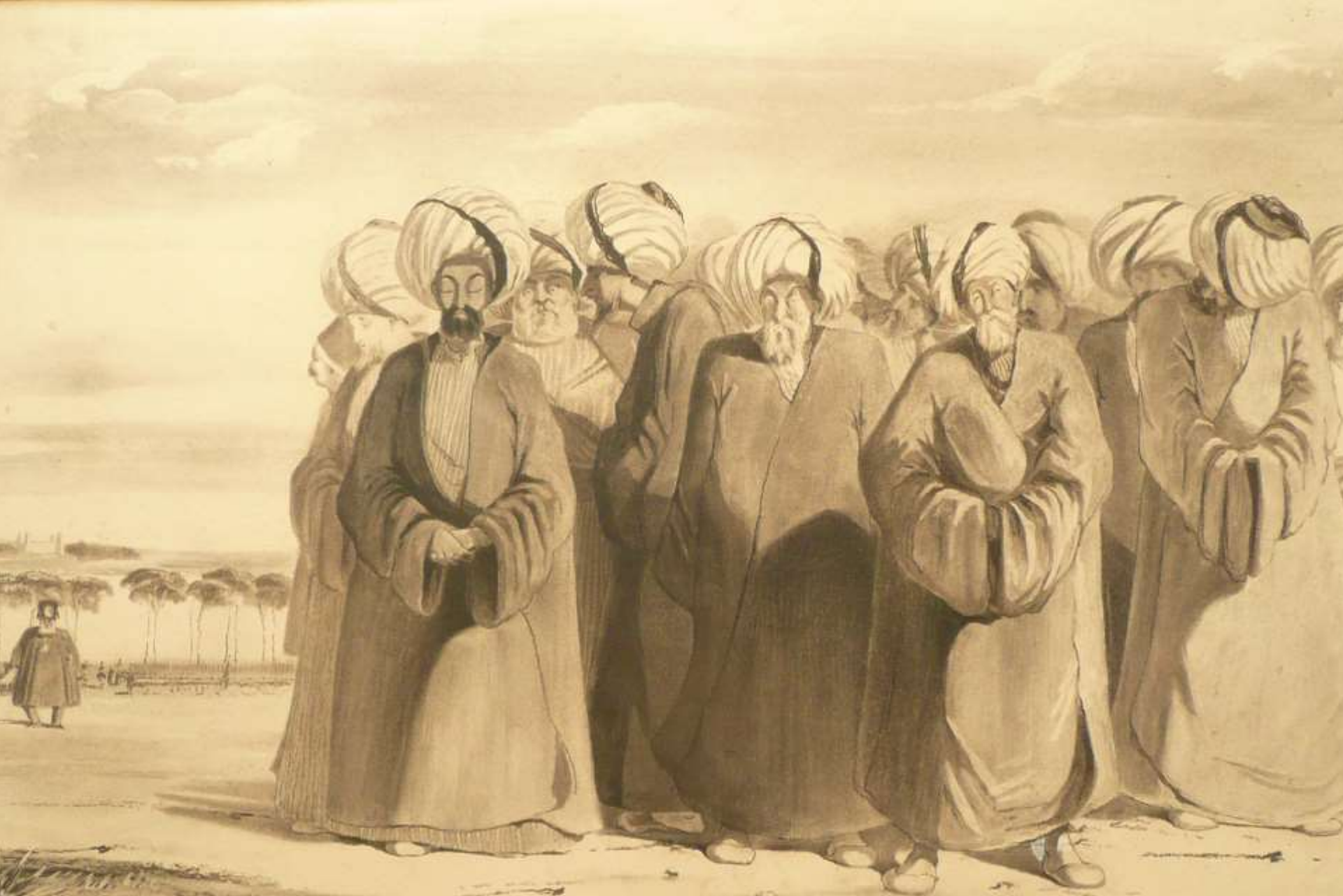
Ulemas écoutant la lecture des lois de réforme à la Cour de Constantinople en 1839. Fr. Oz