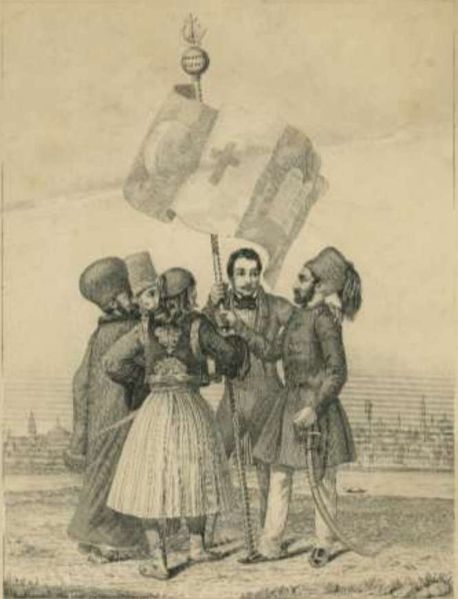
C'union fait la force.