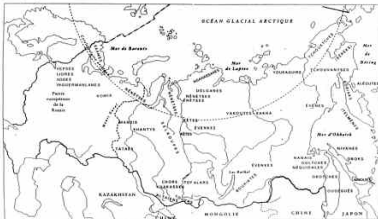
Carte des peuples