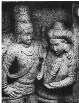
Mahābalipuram, Pallava, VII e siècle. Śiva enseigne les règles du théâtre à Bharata, l'auteur mythique du Nāṭyaśāstra . Bharata se tient dans l'attitude déferente du disciple, bras droit replié, coude reposant dans la paume gauche.