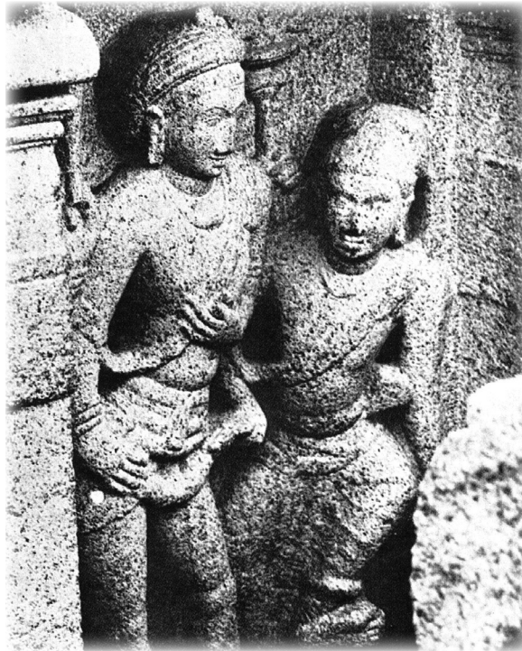
Mahābalipuram, Pallava, VII e siècle. Śiva enseigne l'art de la danse à Taṇḍu, comme il est montré au chapitre IV du Nāṭyaśāstra .