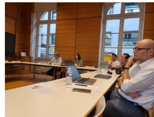
salle 1 du « site Berthelot »