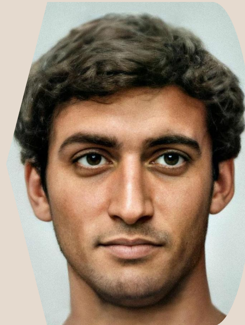
Portrait généré à l'aide de l'IA de Bas Uterwijk