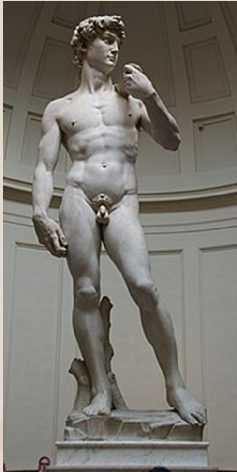
David de Michel-Ange